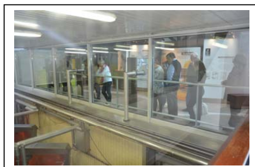
A la Cave coopérative de Beaufort