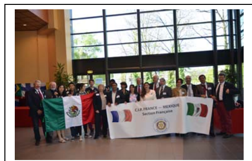
A la Conférence du D1780 avec les Inbounds mexicains