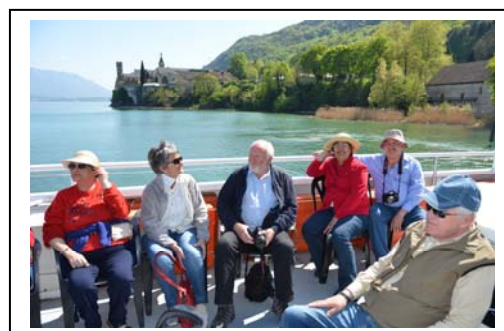
Tour du Lac du Bourget