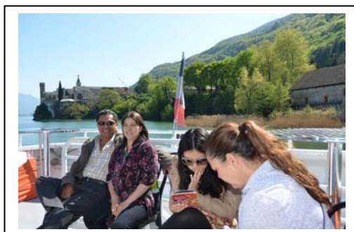
Tour du Lac du Bourget