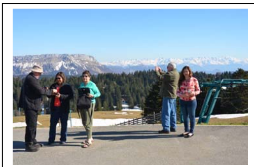
Au Mont Revard

Tous les autres frais ont été pris en charge personnellement par les rotariens qui ont reçu et accompagné nos amis mexicains.