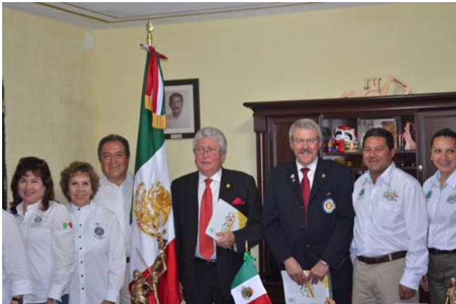
Accueil officiel par le maire de Xico