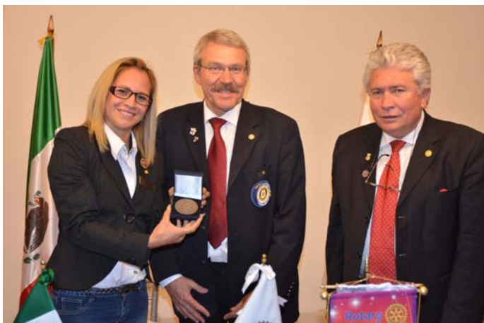
Remise de la médaille commémorative des 20 ans du club de Montmélian La Savoyarde