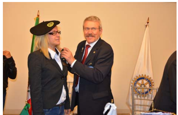
Sans oublier le béret traditionnel français Il ne manquait que la baguette sous le bras, les mexicains ayant ce qu'il faut en vins !!