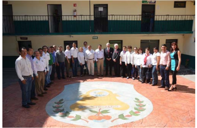
Réception à la session du Club de Xalapa Millenium