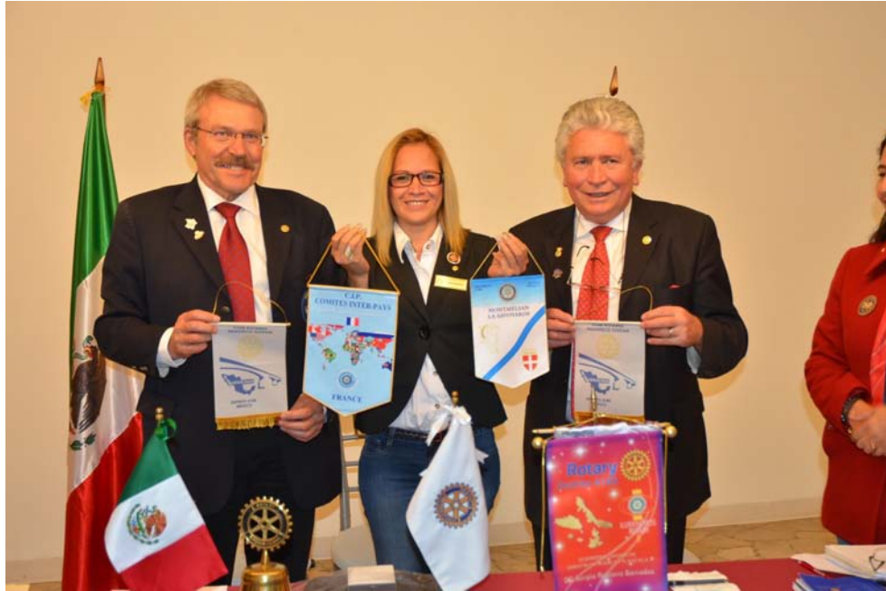
Echange traditionnel des fanions : CIP ; Hutesco Tuxpan ; Montmélian La Savoyarde